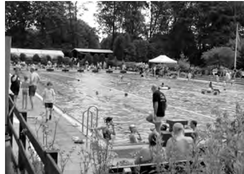
Technik-Crash-Kurs und Stand up Paddling