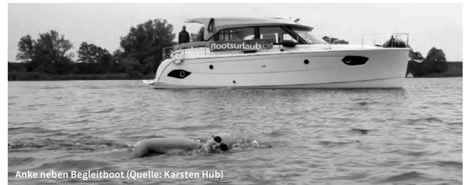
Anke neben Begleitboot