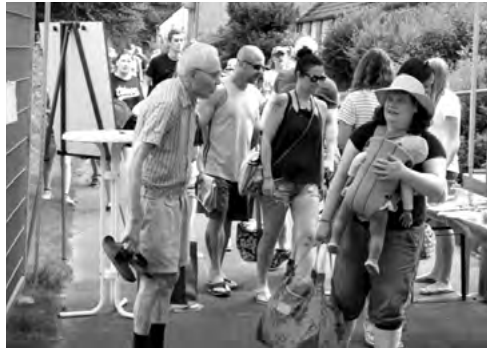
Einlass und Begrüßung der Gäste