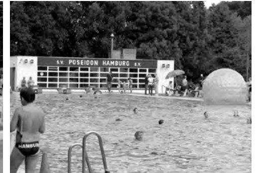
Aquaball im Sportbecken