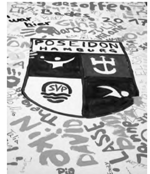
Unterschriftentafel der Poseidon-Olympiade 2017

Viele vermissten in diesem Jahr das Poseidon-Entenrennen, das aber aufgrund der kurzen Vorbereitungszeit leider ausfallen musste. Aber keine Sorge: bei der nächsten Planung wird es bestimmt wieder mit aufgenommen. In der Summe war 2017 wieder eine gelungene Veranstaltung für Jung und Alt Dank des Einsatzes und der Unterstützung vieler freiwilliger Helfer in allen Bereichen (Auf- und Abbau, Catering, Aktionsbetreuung usw.) und