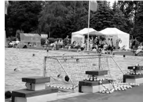
Beachbar und Wasserballspiel